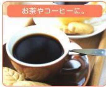
お茶やコーヒーに。

高度なろ過システムにより有機物のほとんどを取り除いた、すっきりとしておいしいお水です。